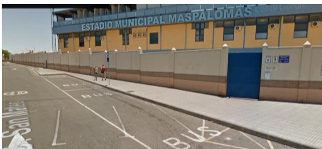
Estadio Municipal de Maspalomas, ubicado en la calle San Mateo s/n Municipio San Bartolomé de Tirajana.

PRIMERO. – De conformidad con la publicación en el BOP Las Palmas nº 136 de fecha 08 de noviembre de 2024, en el que aprueba el listado definitivo de Admitidos y Excluidos de diez (10) plazas de Agentes del S.E.I.S. el Tribunal Calificador acuerda por unanimidad convocar a las personas aspirantes que se relacionan en dicho Boletín nº 136, en llamamiento único para la realización del primer ejercicio obligatorio de la oposición y con carácter práctico, el día 10 de diciembre de 2024, a las 07:45 horas , en el Estadio Municipal de Maspalomas, ubicado en la calle San Mateo s/n, en el Municipio San Bartolomé de Tirajana.