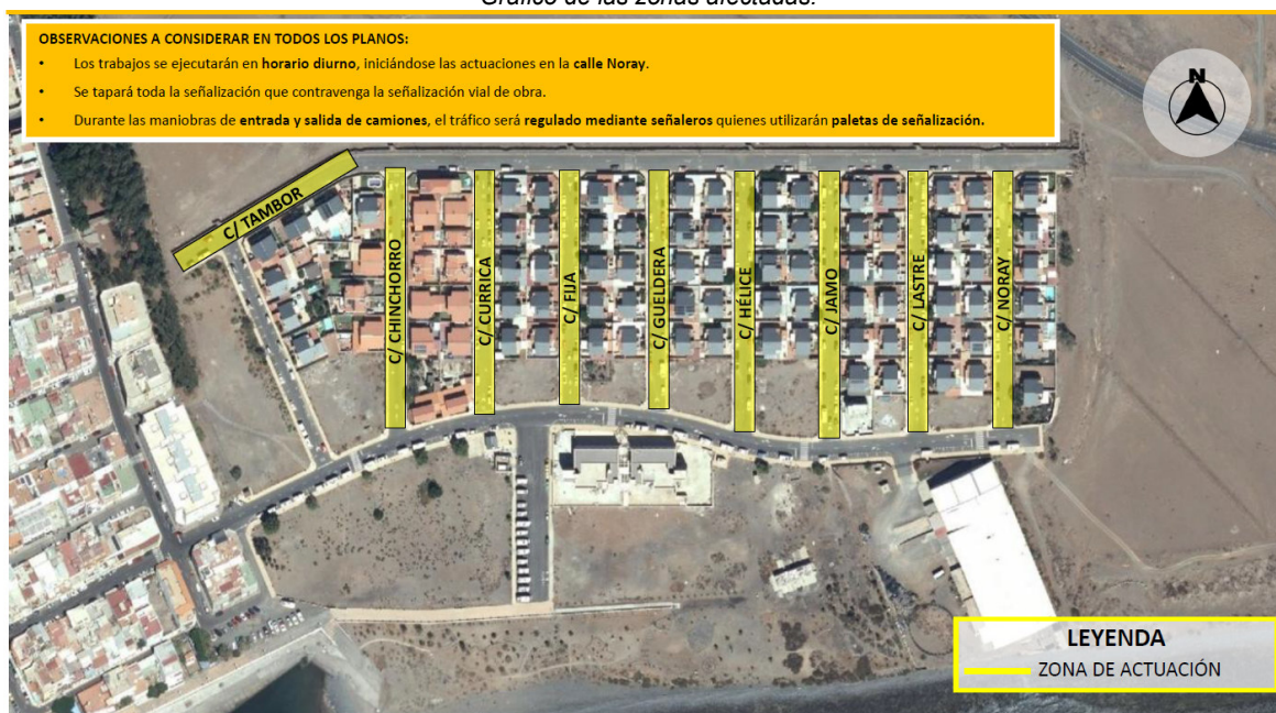
Gráfico de las zonas afectadas:

Se solicita la activa colaboración de la ciudadanía para de este modo minimizar aquellos problemas que se puedan ocasionar en la vía y en el tráfico rodado provocados por la actividad específica, y por lo tanto se recomienda, que estacionen sus vehículos en espacios diferentes a las vías especificadas en el documento, y especialmente, el acatamiento de las instrucciones, señalización e indicaciones de los agentes de la Policía Local y operarios de las obras destinados a tal efecto.