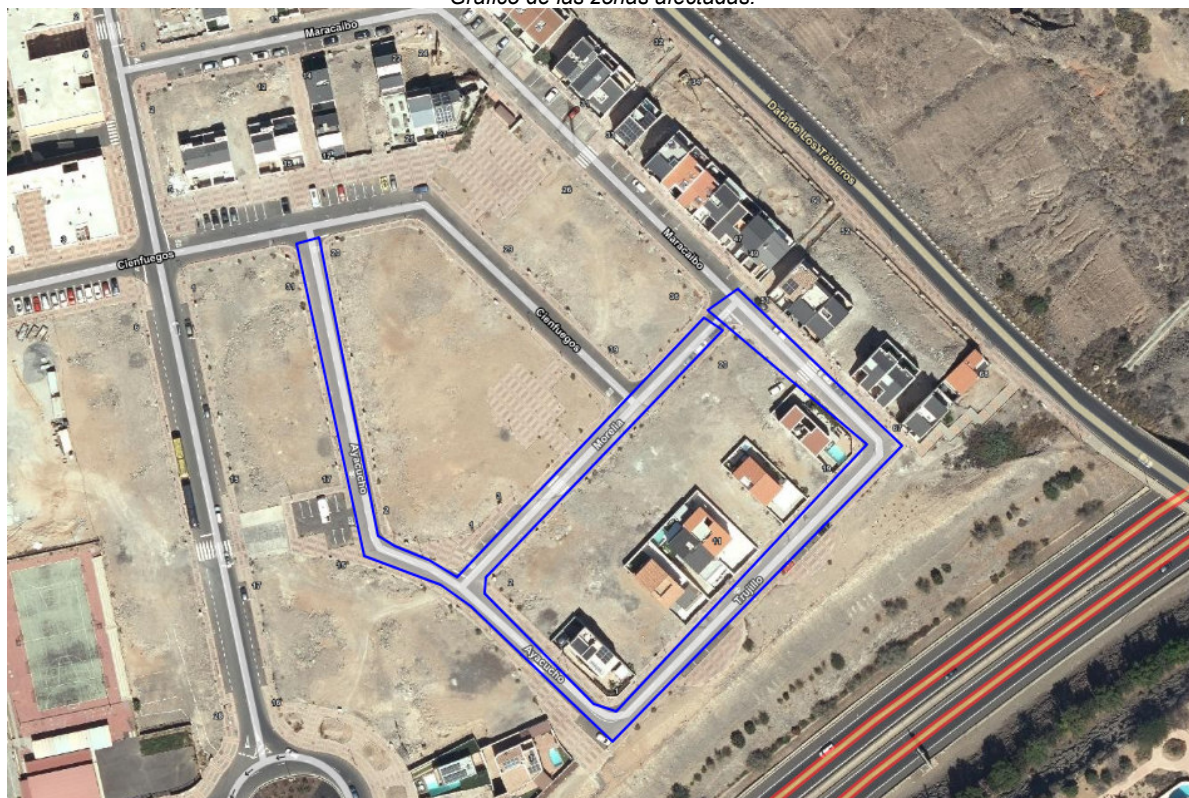
Gráfico de las zonas afectadas: