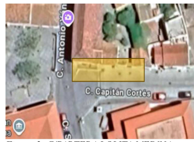
Figura 2: C/PARTERA LOLITA MEDINA

Se solicita la colaboración de la ciudadanía, para de este modo minimizar aquellos problemas que se puedan ocasionar en la vía, y en el tráfico provocados por la actividad específica, por lo tanto se recomienda, que estacionen sus vehículos en espacios diferentes a las vías especificadas en el documento, y especialmente, el acatamiento de las instrucciones, señalización e indicaciones del personal de obras y de los agentes de la Policía Local destinados a tal efecto.